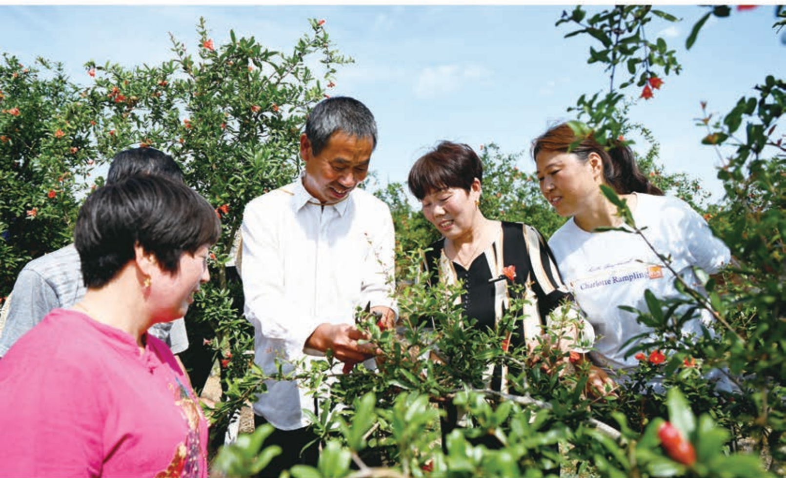
土专家来到石榴园